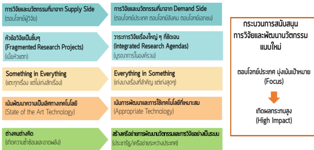
ที่มา : รัฐมนตรีว่าการกระทรวงการอุดมศึกษา วิทยาศาสตร์ วิจัยและนวัตกรรม (ดร.สุวิทย์ เมษินทรีย์)

วิสัยทัศน์ “เตรียมคนไทยแห่งศตวรรษที่ 21 พัฒนาเศรษฐกิจที่กระจายโอกาส อย่างทั่วถึง สังคมที่ มั่นคงและสิ่งแวดล้อมที่ยั่งยืน โดยสร้างความเข้มแข็งทำงานนวัตกรรมระดับแนวหน้าในสากล นำพาประเทศไทยสู่ประเทศที่พัฒนาแล้ว”